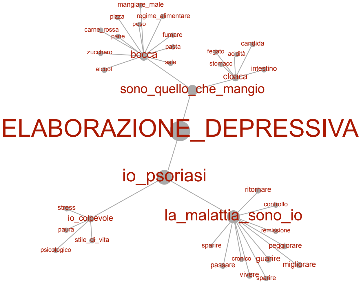
Fig. 4 – L'elaborazione depressiva